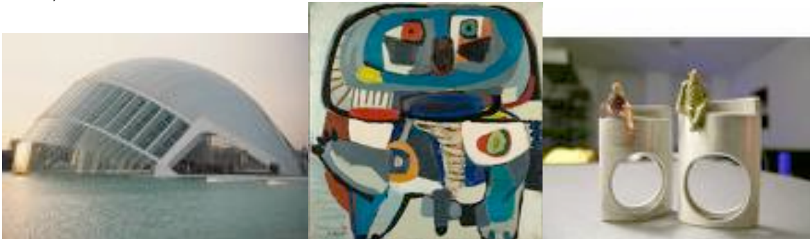
Na oorlogse kunst hfst. 10

In deze groepen worden de leerlingen ingedeeld.