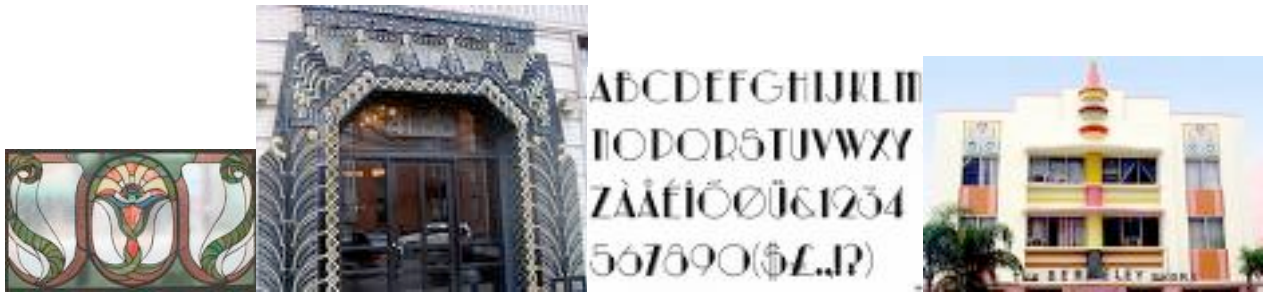
Rond 1900 hfst. 8