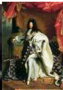
Barok en romantiek hdst. 7