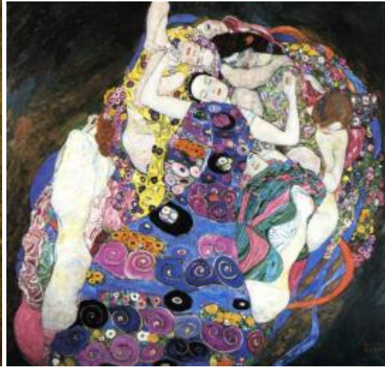
Gustave Klimt 'De maagden'