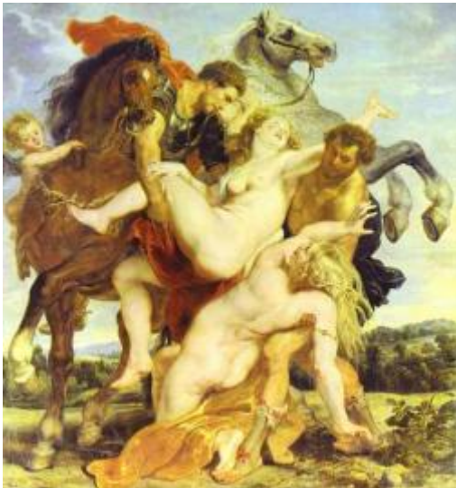
Rubens, Verkrachting van de dochters van Leucippes