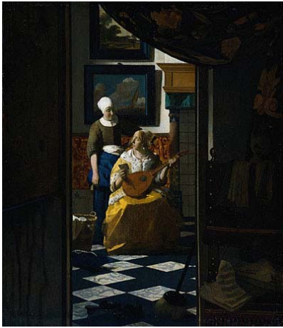
Johannes Vermeer, de brief