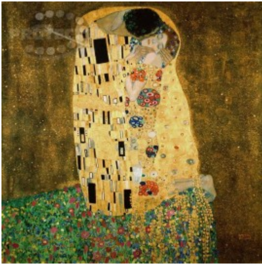
Gustave Klimt 'De kus'